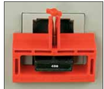
Lockout-enhet for sikringsautomater med stort håndtak