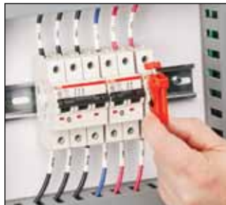
Lockout-enhet for miniatyrsikringsautomater