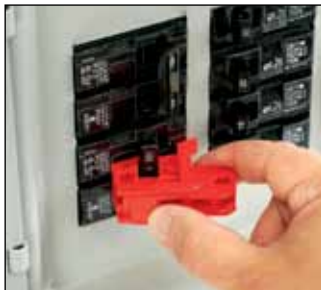
PowerLOK™ lockout-enhet for sikringsautomater