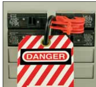
Verktøyfri krets Lockout-enhet for brytere