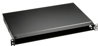
Distribuidores de Fibra Óptica para Montaje en Rack Opticom®