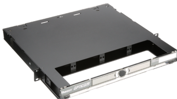
Distribuidores de Casetes de Fibra Óptica para Montaje en Rack Opticom®